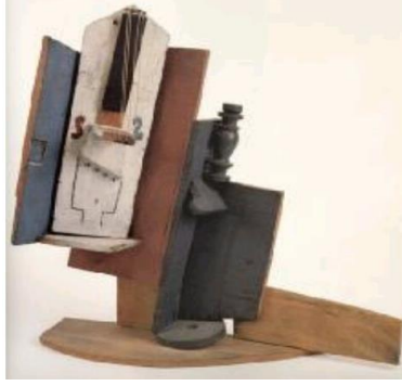
شكل(9) بيكاسو (كمان وزجاجة على الطاولة ) 1915

العمل مكون من قطع من الخشب المطلى ، وخيوط ومسامير واستخدم بيكاسو فى هذا العمل لوحا من الخشب وضعه بشكل أفقى ممثلا بذلك الطاولة ووضع فوقها ألواح خشبية تدل بطريقه او بأخرى على قارورة مستخدما قطعاً خشبية من الأثاث لها شكل عنق القارورة ، والى جانبها أله الكمان التى هى عبارة عن خيوط مثبتة بواسطة مسامير .