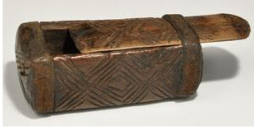
- شكل (6)

"صندوق خشبي قبطي من القرن السادس الميلادي عليه حفر هندسي من جميع الواجه الستة بغطاء منزلق والأشرطة الجلدية ."