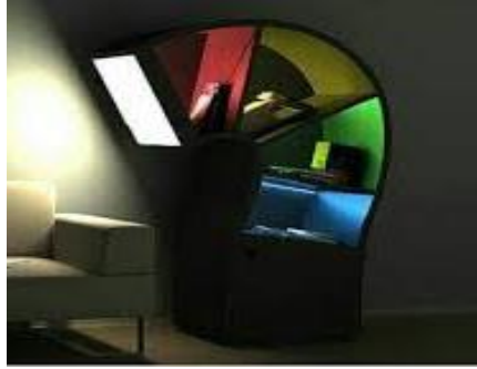
شكل (11) مكتبة خشبية مزودة بوحدة أضاءة (21)

تعتمد عملية تصميم مكملات الأثاث الخشبي على قدرة الفنان على الأبداع لأنه يستغل ثقافته وقدراته التخيلية ومهاراته في أنتاج عمل فني غير مألوف وجديد ويتصف بالأختلاف والجديه ويؤدى في النهاية الى تحقيق الغرض والوظيفة من انتاج تلك مكملات الأثاث الخشبي . وتعد مكملات الأثاث الخشبي هو ابداع وخلق كل ما هو جديد وبما يعاصر حياتنا من أثاث بحيث يضيف علينا الدفء والهدوء ، وذلك لنواكب عصر السرعة الذي نعيش فيه. وهذا ما يميز عمل الفنان المبتكر والذي يقوم بتحويل المكان القديم البالي غير الملفت للنظر الى مكان معاصر متجدد يحوى العديد من مكملات الاثاث الخشبي المبدعه والمتطورة .