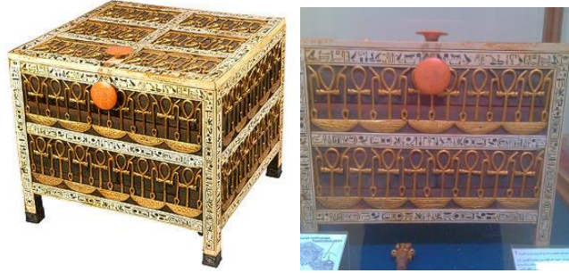
شكل (4)

"ويحتفظ المتحف المصرى على نماذج قيمة من الروائع الفنية والتحف الخشبية النادرة ومن بين مقتنياته الثمينة التي عثر عليها فى مقبرة (توت عنخ أمون)وهى تعد حقا درة فى جبين الفن على مر الدهور . " (2- ص55) - صندوق من الخشب :